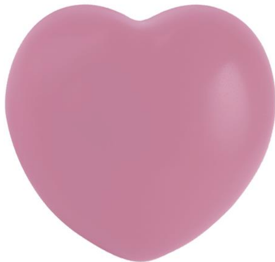
Figura de poliuretano en forma de corazón.